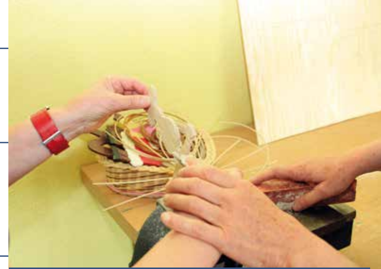
Asklepios Fachklinikum Brandenburg

Klinik für Psychiatrie, Psychosomatik und Psychotherapie